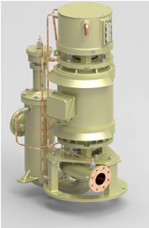
Наименование оборудования: Насосы центробежные судовые самовсасывающие балластно-осушительные типа НЦВС Производитель: АКЦИОНЕРНОЕ ОБЩЕСТВО ПО ПРОИЗВОДСТВУ ЛОПАСТНЫХ ГИДРАВЛИЧЕСКИХ МАШИН