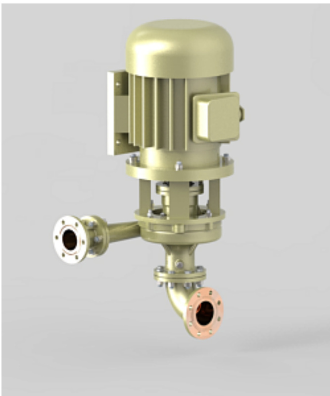
Наименование оборудования: Насосы центробежные вертикальные типа НЦВ