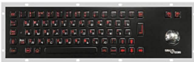
Наименование оборудования: ЭКНИС NavCom Voyager SB-19 Производитель: Общество с ограниченной ответственностью "НавМарин"