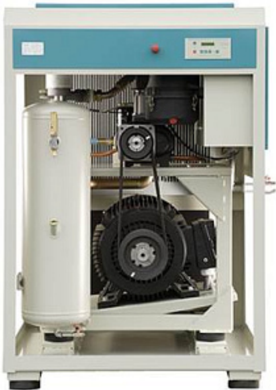
Наименование оборудования: Электрокомпрессор винтовой с прямым приводом РС 109 D Производитель: ОБЩЕСТВО С ОГРАНИЧЕННОЙ ОТВЕТСТВЕННОСТЬЮ "СУДОВЫЕ СИСТЕМЫ"