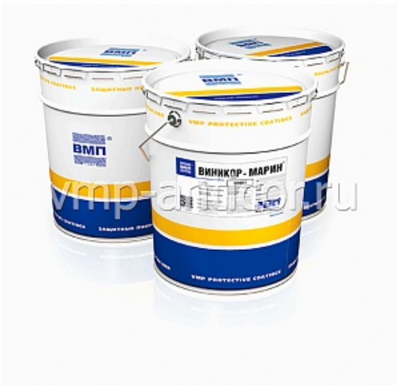
Наименование оборудования: ВИНИКОР-марин, эмаль Производитель: Акционерное общество Научно-производственный холдинг "ВМП"