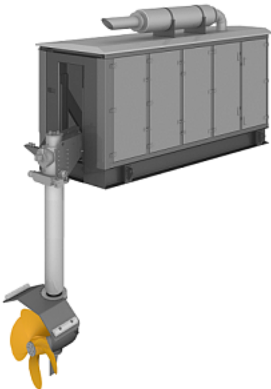
Наименование оборудования: Пропульсивный комплекс В10 1000кВт Производитель: ОБЩЕСТВО С ОГРАНИЧЕННОЙ ОТВЕТСТВЕННОСТЬЮ "МЕХАНИКА-Р"