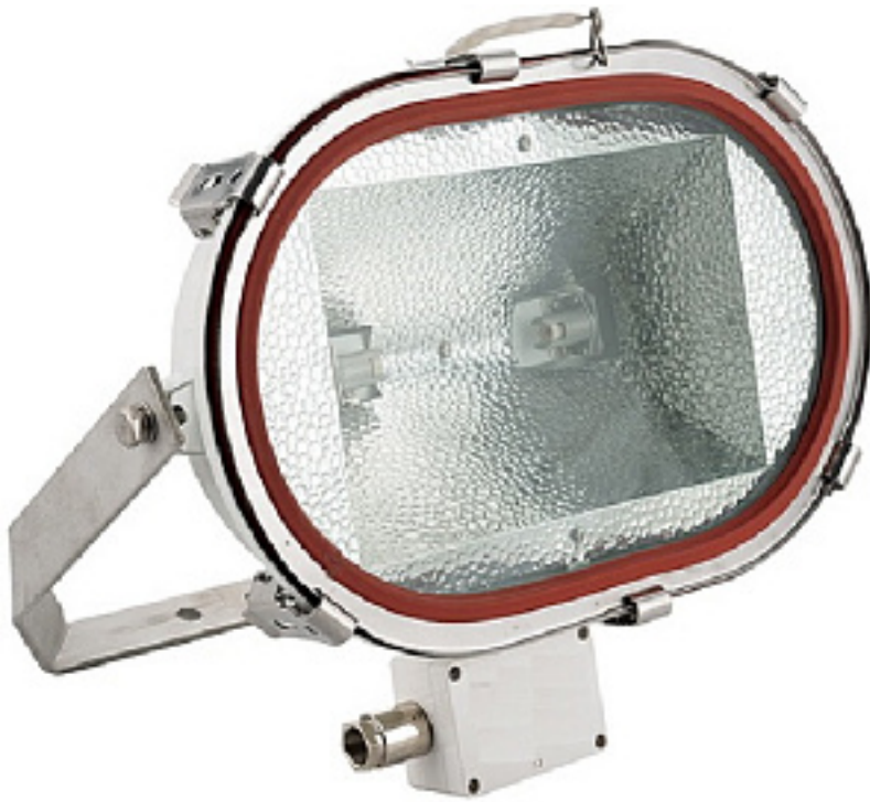
Наименование оборудования: Прожектор заливающего света ПС2-500Г/300Г/200Г Производитель: ОБЩЕСТВО С ОГРАНИЧЕННОЙ ОТВЕТСТВЕННОСТЬЮ "СУДОСВЕТ"