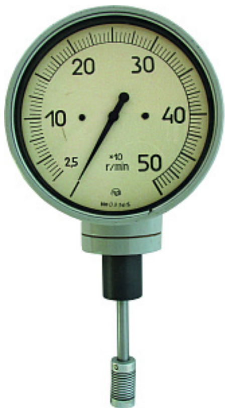
Наименование оборудования: Тахометры магнитоиндукционные ТМ Производитель: ПУБЛИЧНОЕ АКЦИОНЕРНОЕ ОБЩЕСТВО "САРАНСКИЙ ПРИБОРОСТРОИТЕЛЬНЫЙ ЗАВОД"