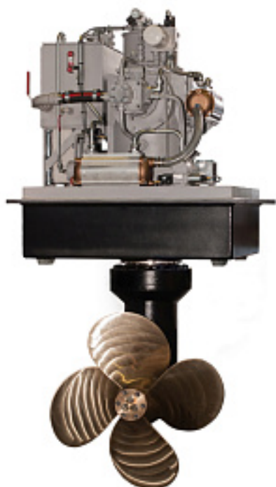
Наименование оборудования: Винто-рулевая колонка А03 250кВт Производитель: ОБЩЕСТВО С ОГРАНИЧЕННОЙ ОТВЕТСТВЕННОСТЬЮ "МЕХАНИКА-Р"