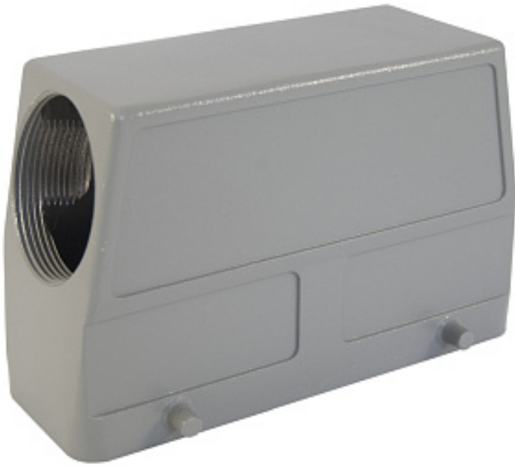
Наименование оборудования: Корпус КМ-КВ-1Б/РГ29-2В-104х27 Производитель: АКЦИОНЕРНОЕ ОБЩЕСТВО "НАУЧНОПРОИЗВОДСТВЕННОЕ ОБЪЕДИНЕНИЕ "КАСКАД"