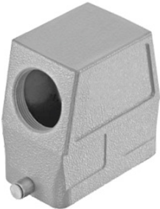
Наименование оборудования: Корпус КМ-КВ-1Б/М32-1В-57х27 Производитель: АКЦИОНЕРНОЕ ОБЩЕСТВО "НАУЧНОПРОИЗВОДСТВЕННОЕ ОБЪЕДИНЕНИЕ "КАСКАД"