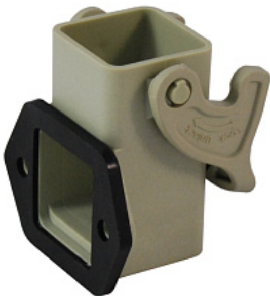
Наименование оборудования: Корпус КП-ПУ-0-1С-22x22 Производитель: АКЦИОНЕРНОЕ ОБЩЕСТВО "НАУЧНОПРОИЗВОДСТВЕННОЕ ОБЪЕДИНЕНИЕ "КАСКАД"