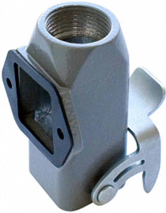
Наименование оборудования: Корпус КМТ-ПУ-1П/М20-1С-22х22 Производитель: АКЦИОНЕРНОЕ ОБЩЕСТВО "НАУЧНОПРОИЗВОДСТВЕННОЕ ОБЪЕДИНЕНИЕ "КАСКАД"