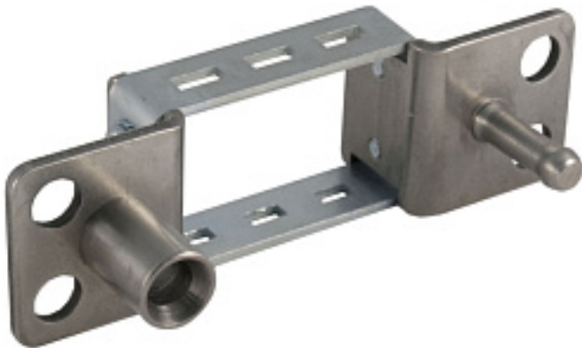
Наименование оборудования: Рамка установочная модульная РУ-М3 Производитель: АКЦИОНЕРНОЕ ОБЩЕСТВО "НАУЧНОПРОИЗВОДСТВЕННОЕ ОБЪЕДИНЕНИЕ "КАСКАД"